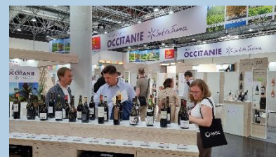
Photos Prowein 2022. Non contractuelles.