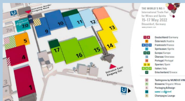
Répartition des halls en 2022

La plateforme www.teamfrance-export.fr/occitanie regroupe l'ensemble des services de ses membres et informe sur le plan de relance pour les entreprises exportatrices.