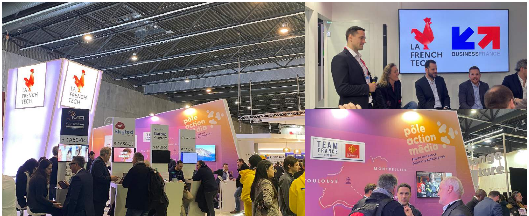
Stand collectif Pôle Action Média /Région Occitanie / Business France