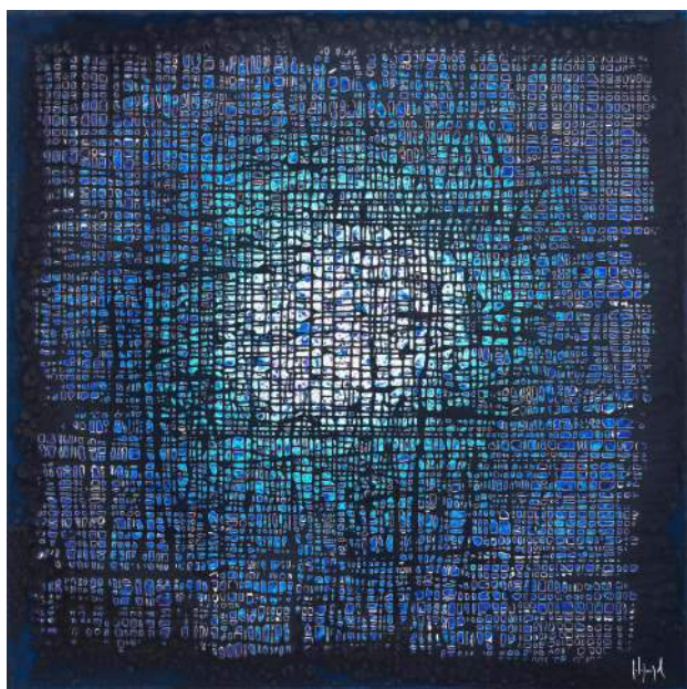
n°336, 100x100 cm, ©Pierre-Luc Poujol

Pierre-Luc Poujol sera le premier artiste à présenter à cette occasion une dizaine de grands formats dont des oeuvres exposées au Musée Paul Valéry à Sète, dans le cadre de l'exposition « Voyage à Giverny » en 2020 où il rendait un vibrant hommage au maître de l'impressionnisme et de la lumière.