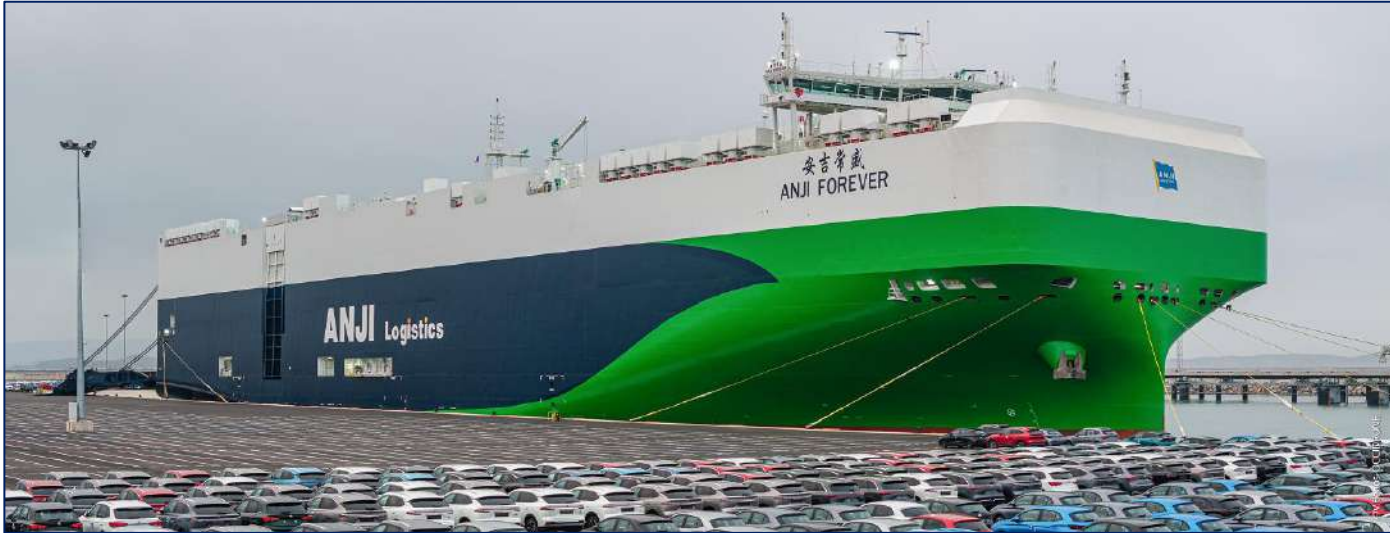
ANJI FOREVER – First call (03/03/2026) – LOA = 228 m – 5 300 cars

Môle Marchandise : En phase d'exploitation avec le lancement d'un contrat RoRo à longue durée de 20 ans.